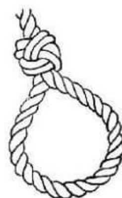
D/ Bien serré les 2 Noeuds & coupé le surplus