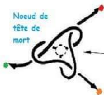
C/ Puis faire un noeud tête mort, comme le schéma, vers le bas