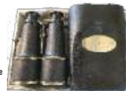
Paire de jumelles offerte par M. PACHA, maire de St Nazaire (var) lors des 1ères régates de Saint Nazaire en 1867.

Le parcours triangulaire est disposé au plus près de la côte pour assurer un spectacle visible sur tout le pourtour de la baie.